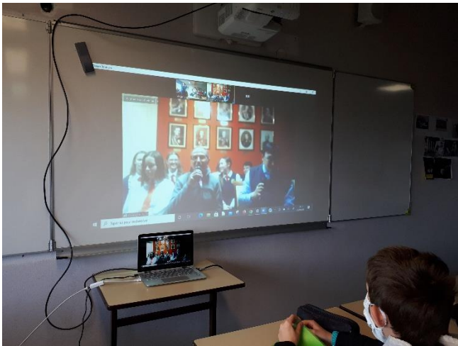
Allocution du scientifique russe