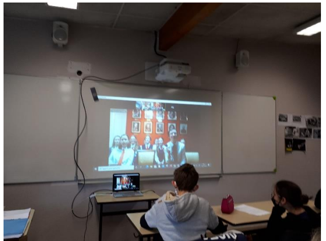
Échanges avec l'équipe russe