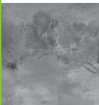
Les grands arbres au Printemps