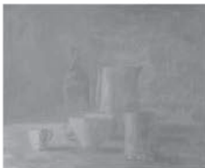
Coin de Table