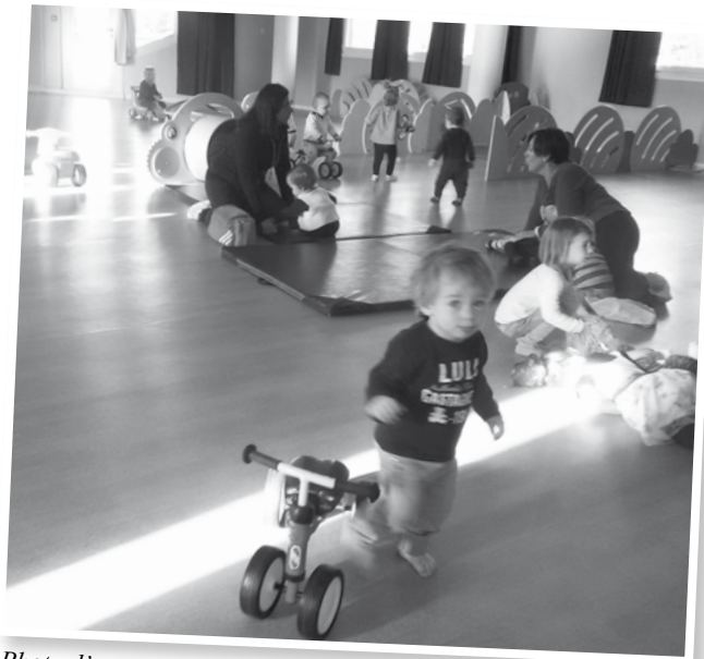
Photo d'un temps collectif à la maison de l'enfance, Douvaine

L'été est déjà loin et le RAM intercommunal a repris toutes ses activités : rendez-vous, permanences téléphoniques et, bien sur, les temps d'accueils collectifs pour les assistants maternels, les gardes d'enfants à domicile et les enfants accueillis.