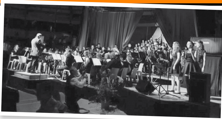
L'harmonie et l'école de musique lors du dernier concert cabaret début juin