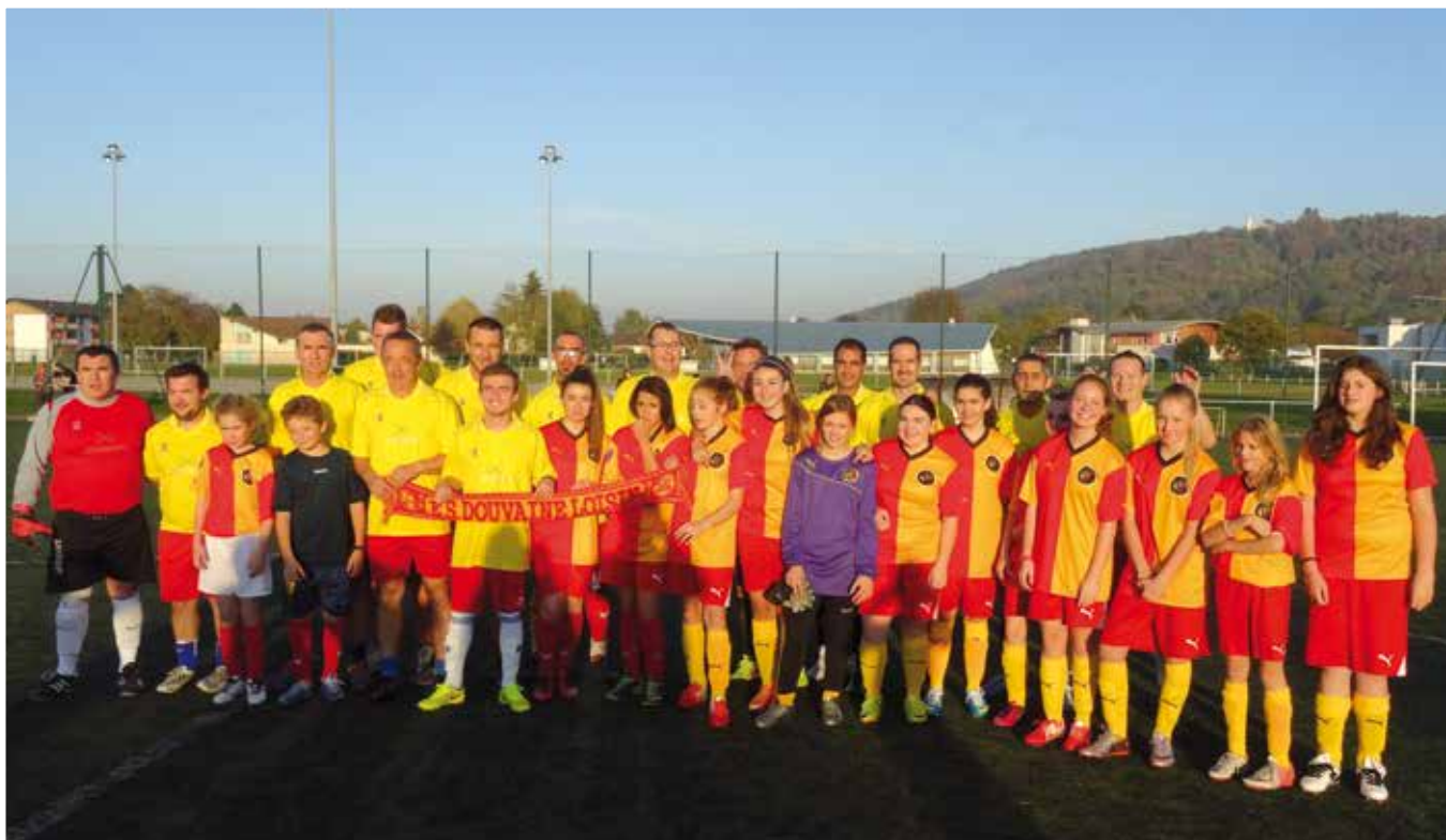
Match Féminines contre Parents-Educateurs