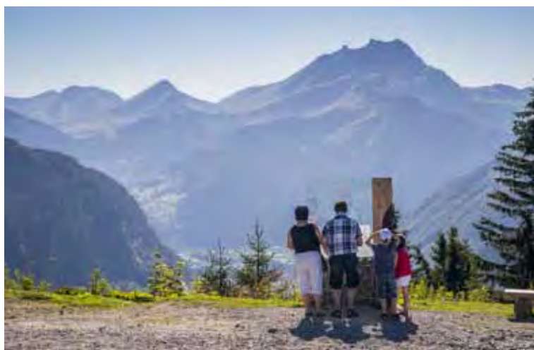
Cot de Bassachaux

*Une participation pourra être demandée dans le cadre d'activité nécessitant du matériel spécifique.